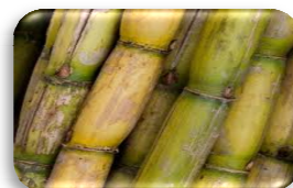
อ้อยโรงงาน

ข้าวโพดเลี้ยงสัตว์รุ่น 1 ปีเพาะปลูก 2558/59 จังหวัดชัยนาทเริ่มเพาะปลูก จังหวัดลพบุรีอยู่ในระยะเจริญเติบโตและออกดอกหัว การเจริญเติบโตไม่ดีเนื่องจากปริมาณน้ำไม่เพียงพอ บางพื้นที่ขึ้นต้นตาย เกษตรกรไถทิ้งและเตรียมปลูกใหม่