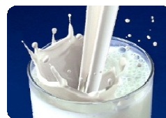
น้ำนมดิบ

ราคาไข่ไก่เบอร์คละที่เกษตรกรขายได้ที่ฟาร์ม ร้อย ฟองละ 267.00, 247.50, และ 288.75 บาท ตามลำดับ