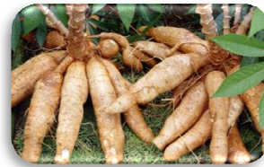
มันสำปะหลังโรงงาน

ราคาที่เกษตรกรขายได้ ข้าวเปลือกเจ้านาปรัง ความชื้น 15% พันธุ์ กข. ต้นละ 8,350 บาท ความชื้น 14-15% พันธุ์หอมปทุมธานี 1 ต้นละ 12,037.50 – 12,337.50 บาท